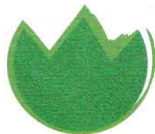
Urmă de pas

Perfect pentru a reprezenta o gustare delicioasă cu fructe.